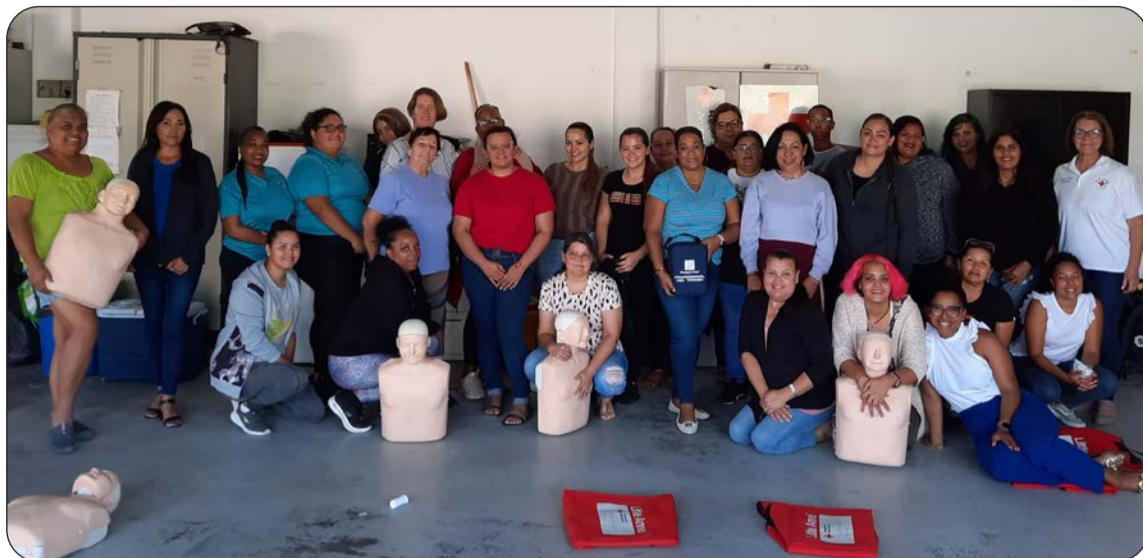
Grupo 1: After the Bell, Building Bright Beginnings, Centro di Cuido Moises, De kleine Ontdekkers, De pareltjes, E barco di Noah, Eiva Conta Stroia, Faith Day & Night Speelschool, Kerekentenchi, Mijn Schatjes, Pica Piedra Speelschool, Pretty Flower Speelschool, Sina y crece, Stichting Kids Creation, The Cradle Daycare, Villa Gumbs

Un curso exitoso tras di lomba caminda FPNM ta gradici Brandweer Aruba, Rode Kruis y Jeugdgezondheidszorg pa nan tremendo instruccion y ta felicita cada trahado pedagogico, deseando nan exito den nan trabou cu mucha!